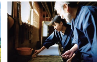
こだわりの製法や工場