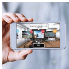
専用アプリケーション