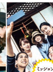
ミッション クリア！