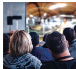
VR体験を大画面で共有