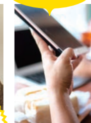
詳細情報 ▶▶▶ 店舗来店