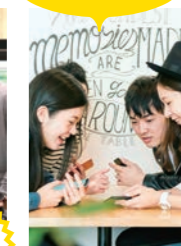
シェア ▶▶▶ 観光