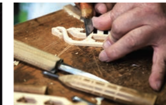
職人の技が映える