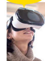
再体験 ▶▶▶ ネット購入