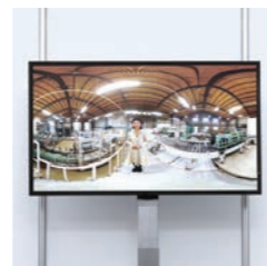
プロジェクション大型モニター