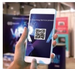
コンテンツごとのTO GO コード表示