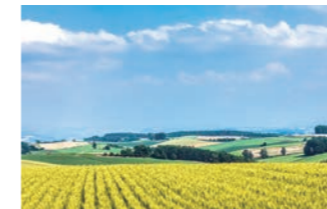
産地の恵みが自慢