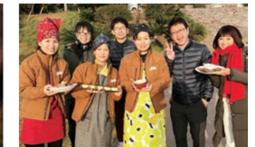
観光にも来て欲しい